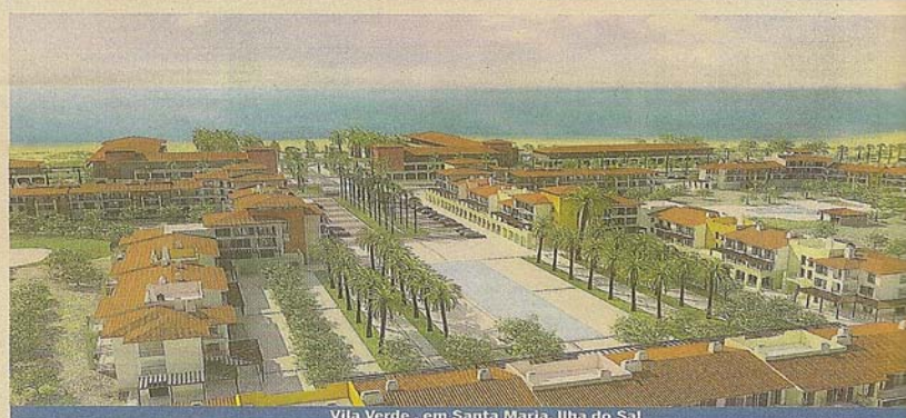
Vila Verde, em Santa Maria, Ilha do Sal