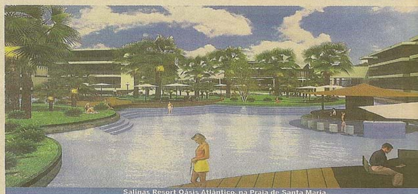
Salinas Resort Oásis Atlântico, na Praia de Santa Maria